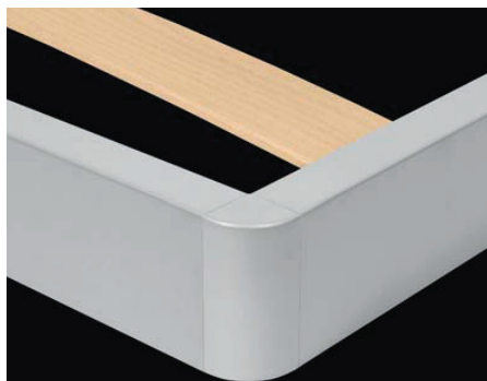
Уголки из прессованного алюминия