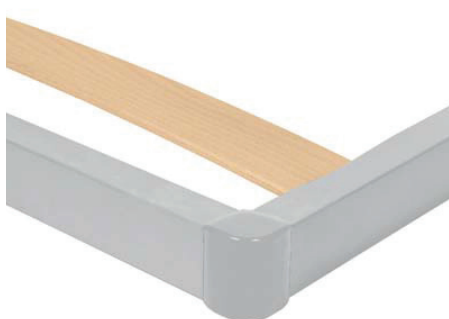
Элемент профиля из нержавеющей стали.

Прямой сварной металлический профиль с видимым сечением 50x30 мм и отделочными углами из контрастного пластика. В каркас вставлена 68-миллиметровая однореечная система, 2 цветные и рифленые рейки для области плеч и 3 рейки с регулировкой жесткости. Оборудована металлическими навинчивающимися ножками \varnothing 50 мм.