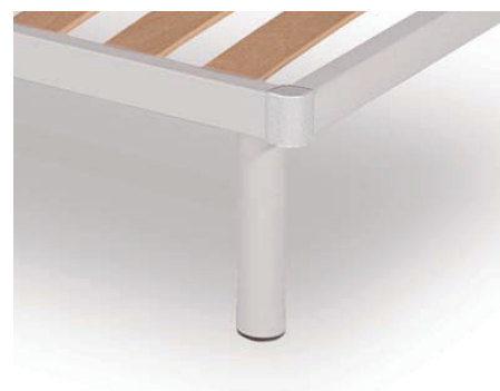
Элемент металлическими ножками. Высота в готовом виде 30 - 35 - 40