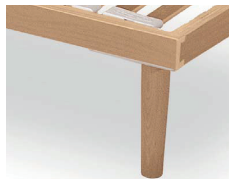
Деревянная ножка в готовом виде высота 30/35/40