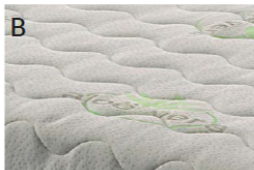
В Верхний слой АЛОЭ ВЕРА. Стирка при 60°.