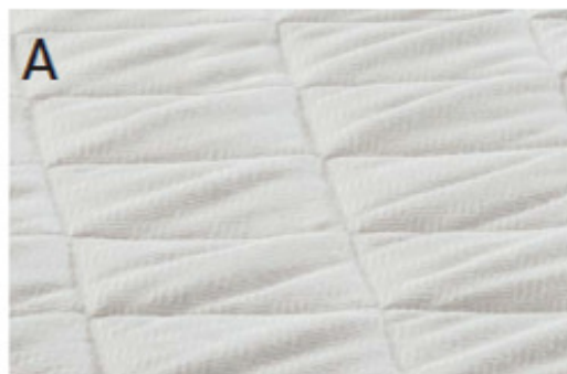
А ГИПОАЛЛЕРГЕННЫЙ верхний слой. Стирка при 60°.