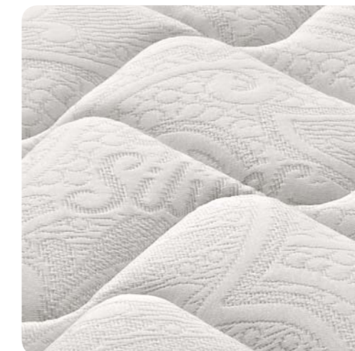
Tessuto con trattamento Silver antibatterico.