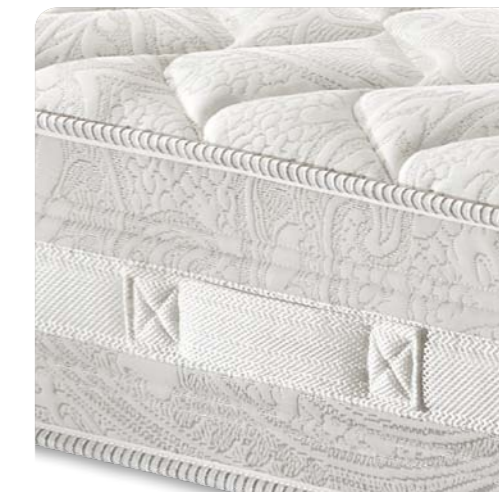
Fascia laterale completa di inserto 3D applicato e maniglie per il posizionamento sul piano letto.