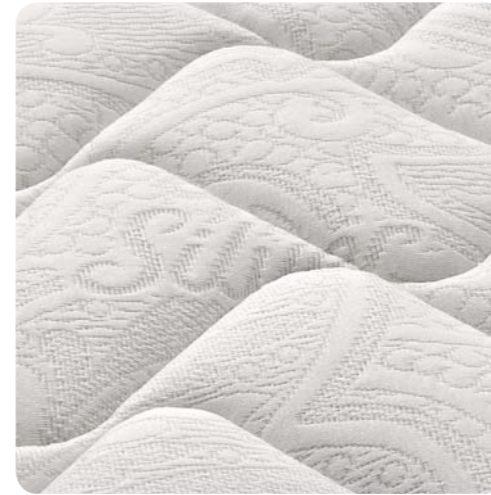
Tessuto con trattamento Silver antibatterico.