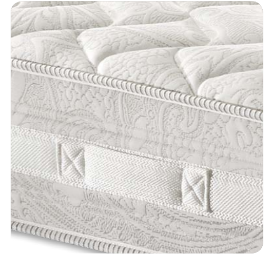
Fascia laterale completa di inserto 3D applicato e maniglie per il posizionamento del materasso sul piano letto.