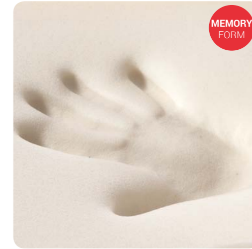
Strato Memory da 2 cm trapuntato nel lato invernale. Lato estivo, con imbottitura in misto cotone bianco.