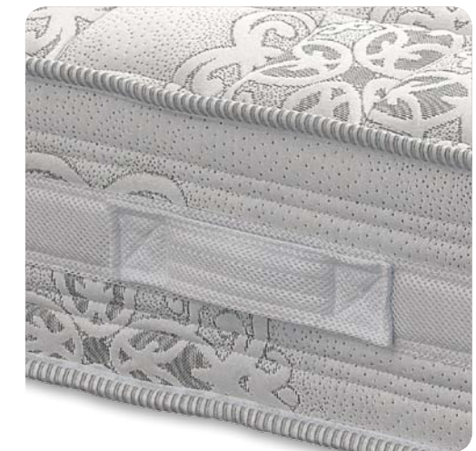
Fascia laterale lavorata completa di inserto 3D traspirante e maniglie in stoffa per il posizionamento del materasso sul piano letto.