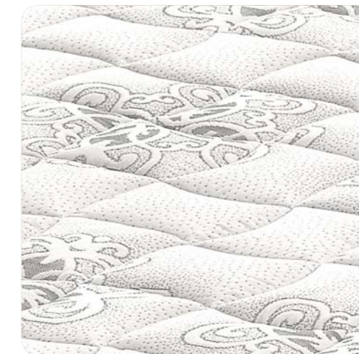
Tessuto con trattamento antipilling.