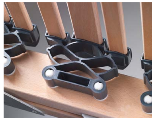
Ammortizzatore multicella in Mytrell®