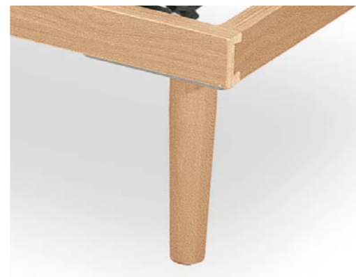
Piedino in legno altezza finita 30/35/40